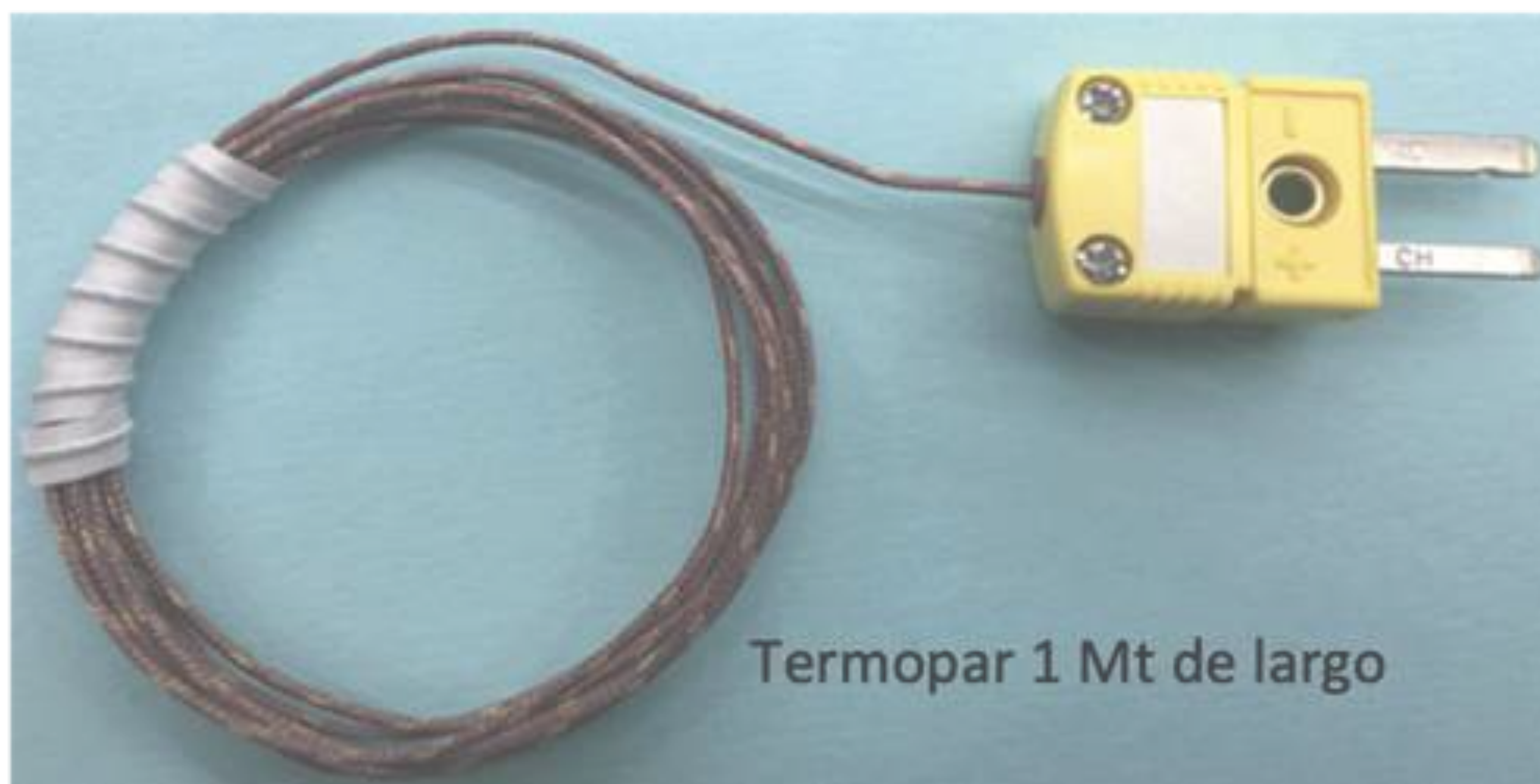
Termopar 1 Mt de largo