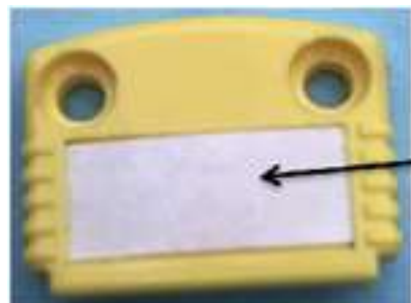
Etiqueta para identificación